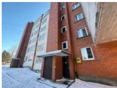
Daudzdzīvokļu dzīvojamā ēka