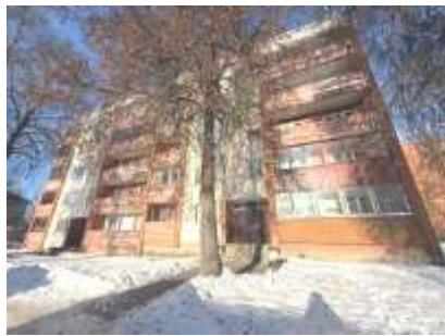
Daudzdzīvokļu dzīvojamā ēka