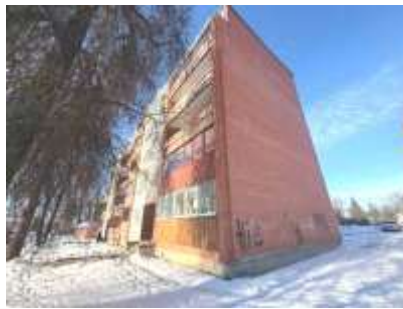
Daudzdzīvokļu dzīvojamā ēka