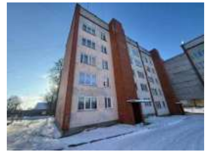
Daudzdzīvokļu dzīvojamā ēka